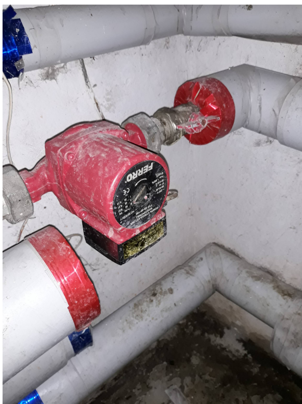
Fot. 10. Pompa ładująca na wymiennik cww