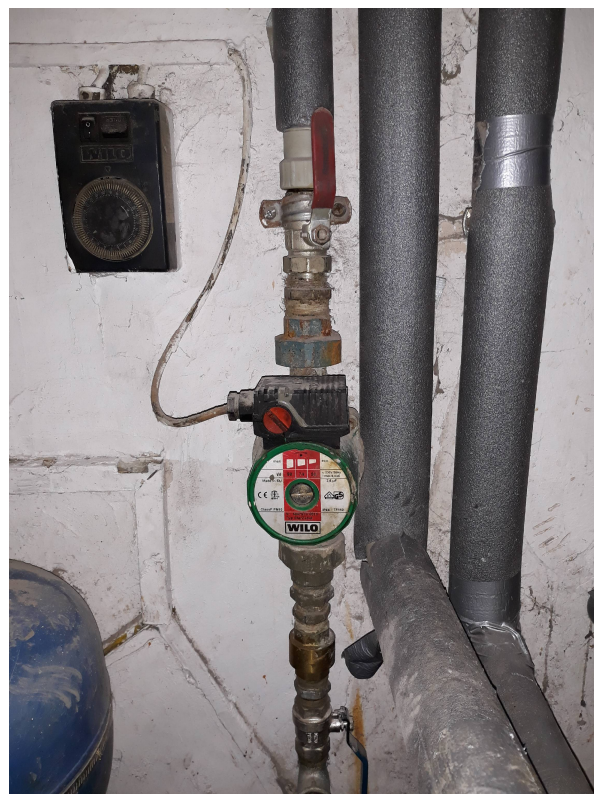
Fot. 9. Pompa cyrkulacyjna z zegarem