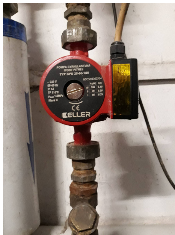
Fot. 11. Pompa obiegowa centr. ogrzewania