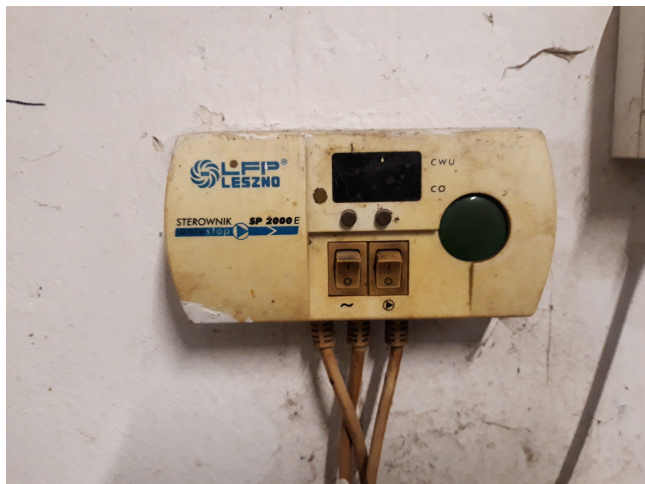
Fot. 12. Termostat cwu podgrzew. pojemność.