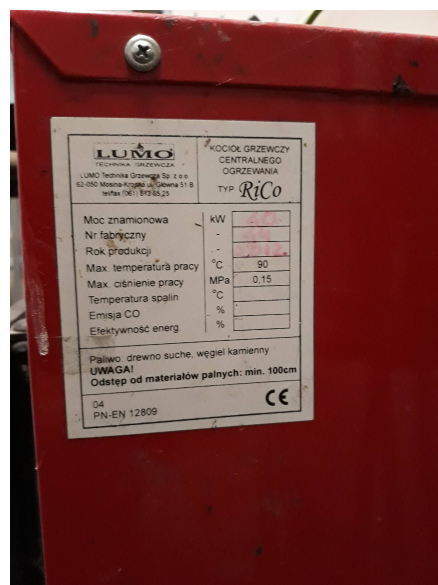
Fot.2.Tabliczka znamionowa kotła