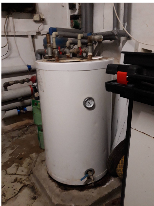
Fot.4. Pionowy wymiennik cwu