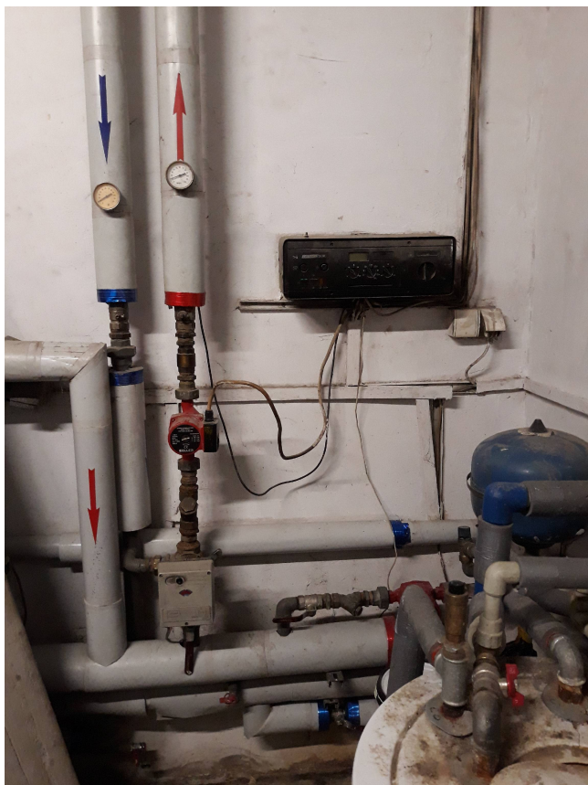
Fot. 8. Rozdzielacz z automatyką sterującą