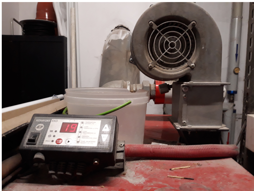
Fot. 3. Sterowanie kotła