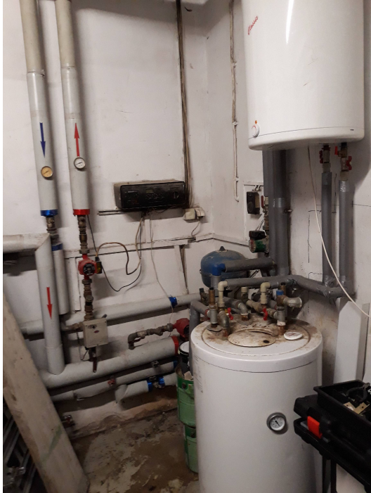
Fot. 6. Podłączenie wymienników cwu