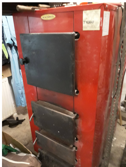
Fot. 1. Kocioł grzewczy