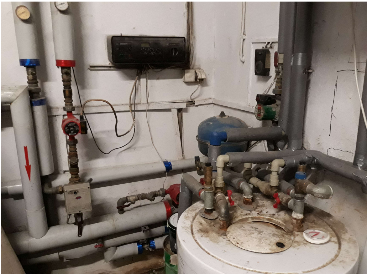
Fot. 7. Instalacja przyłączeniowa (w głębi pompa cyrkulacyjna i zegar sterujący)