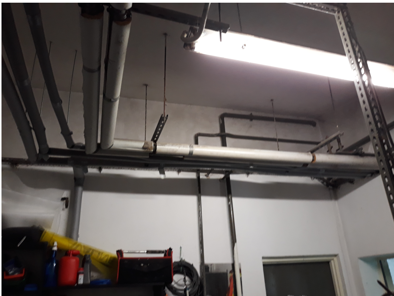
Fot. 13. Wyjście instalacji grzewczej z kotłowni (odpowietrzenie) i rury zabezpieczenia kotła