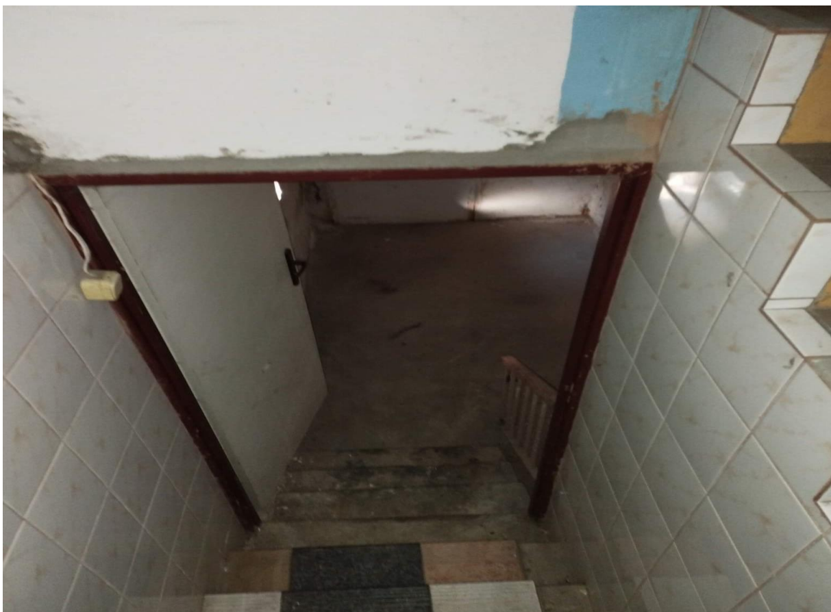
Zejdźcie do piwnicy.