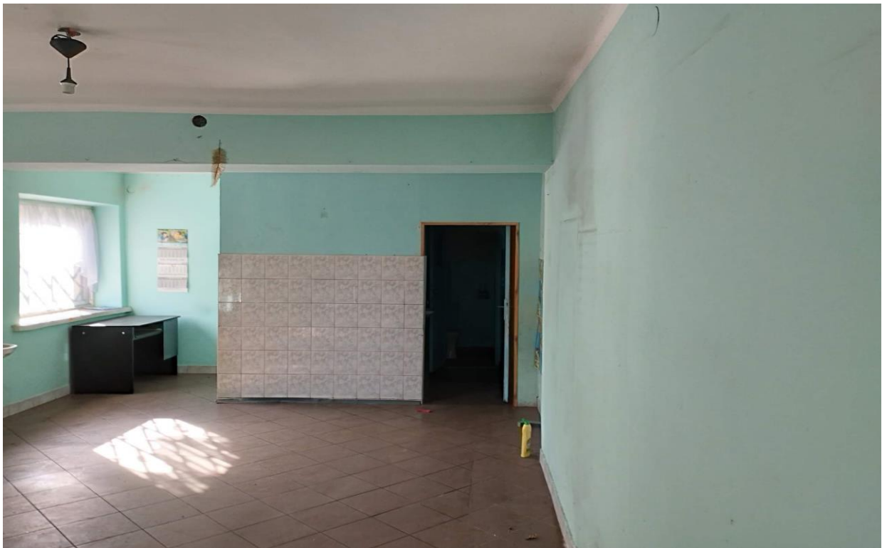
Pomieszczenie na parterze.