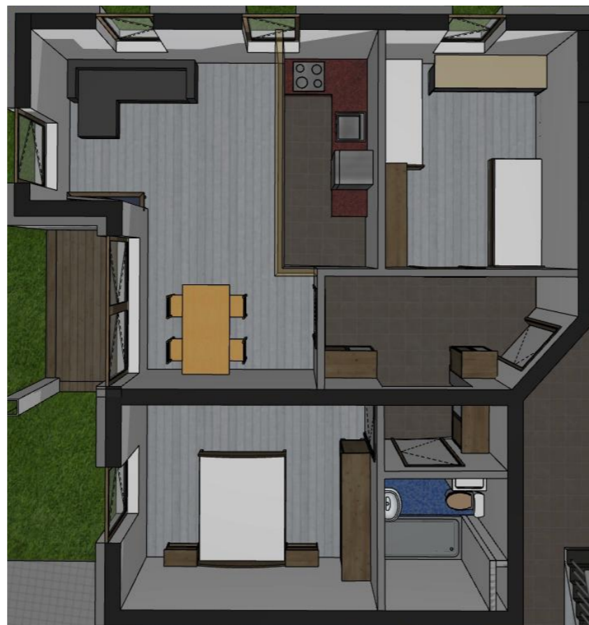
Wnętrza B 1.1 M3

B 1.1 M3 powierzchnia użytkowa: st. surowy - 63,4m 2 st. wykończony - 62m 2