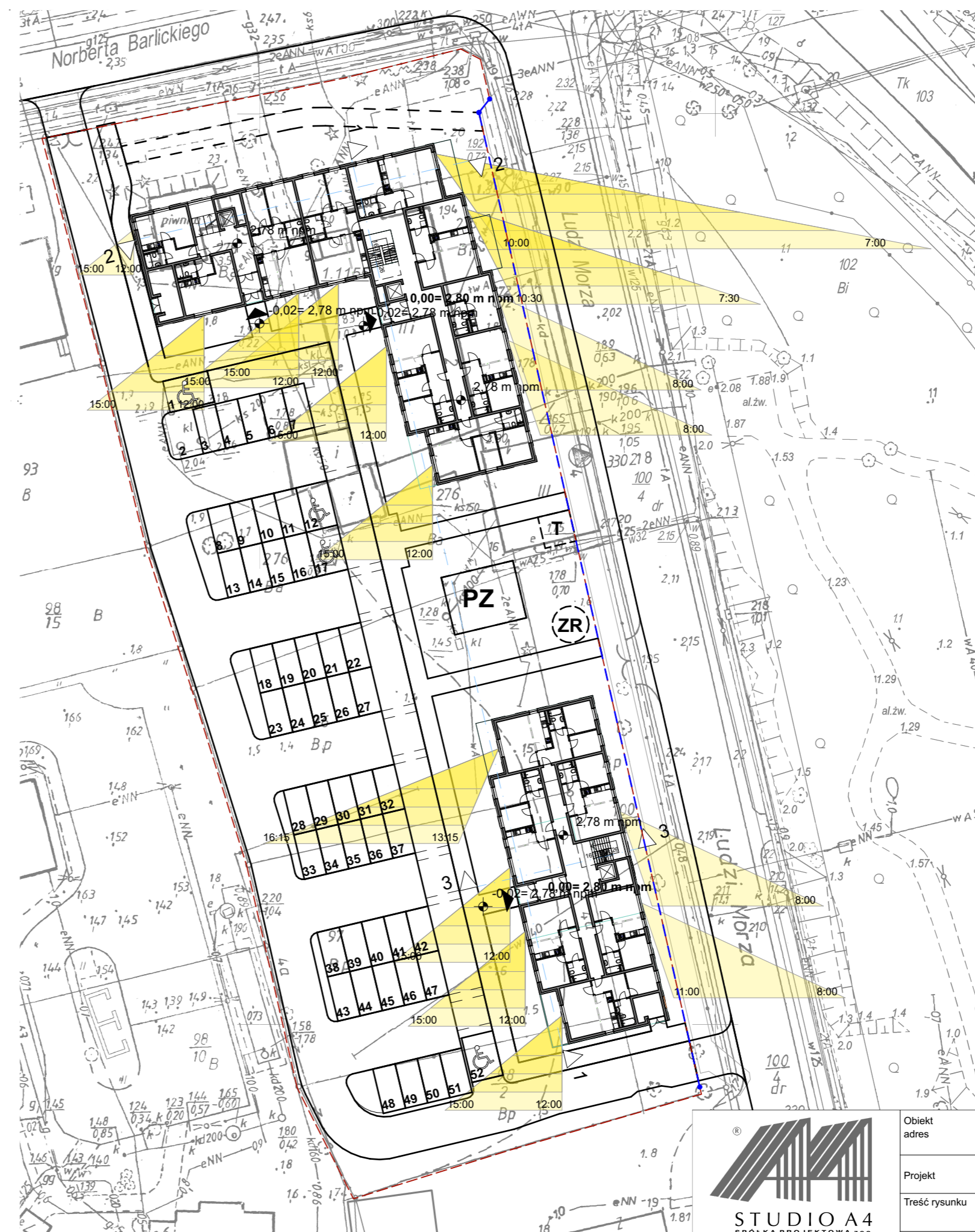
Analiza nasłonecznienie okien budynku Skala 1:500