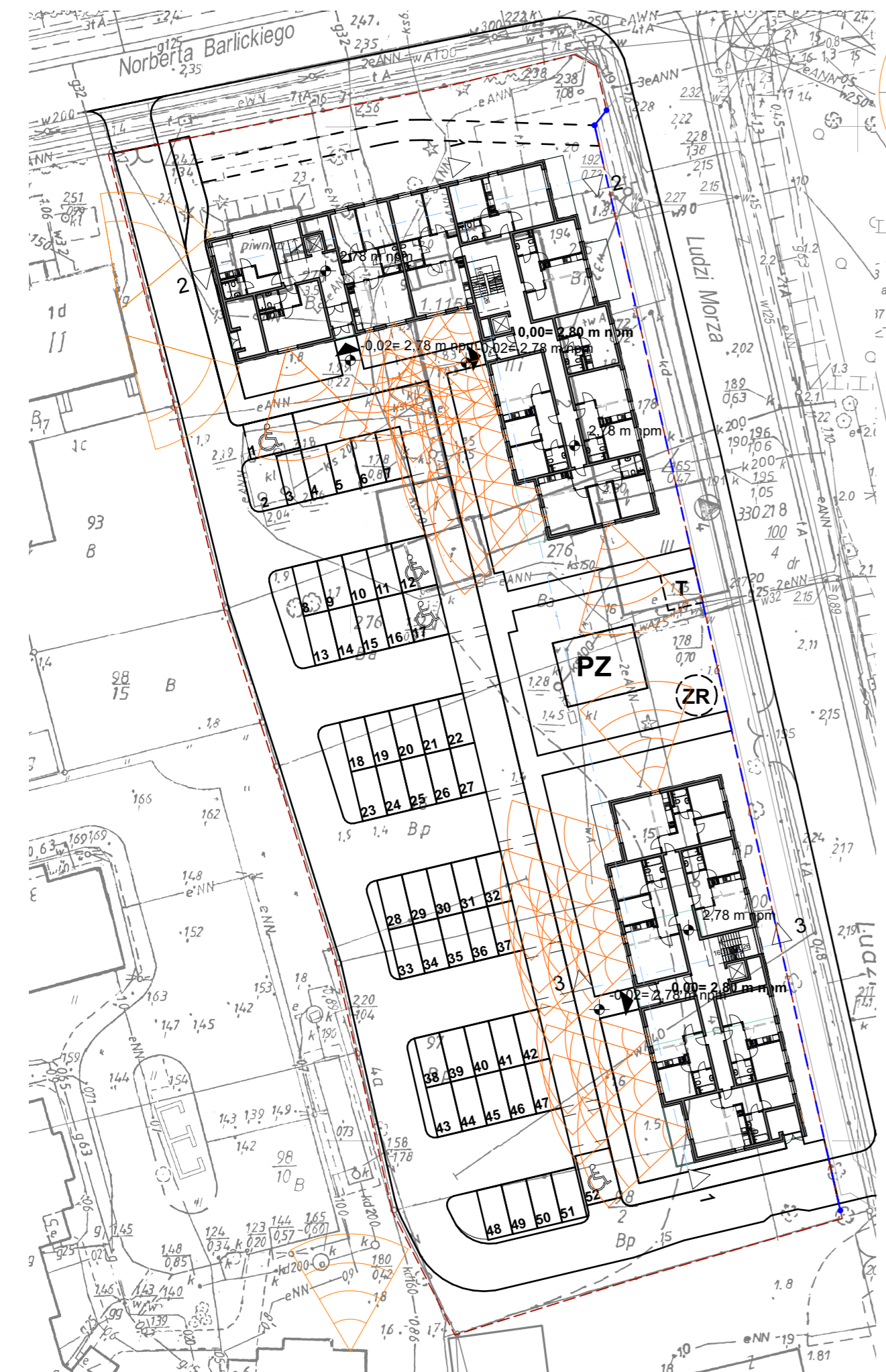
Analiza przesłaniania okien budynku Skala 1:500