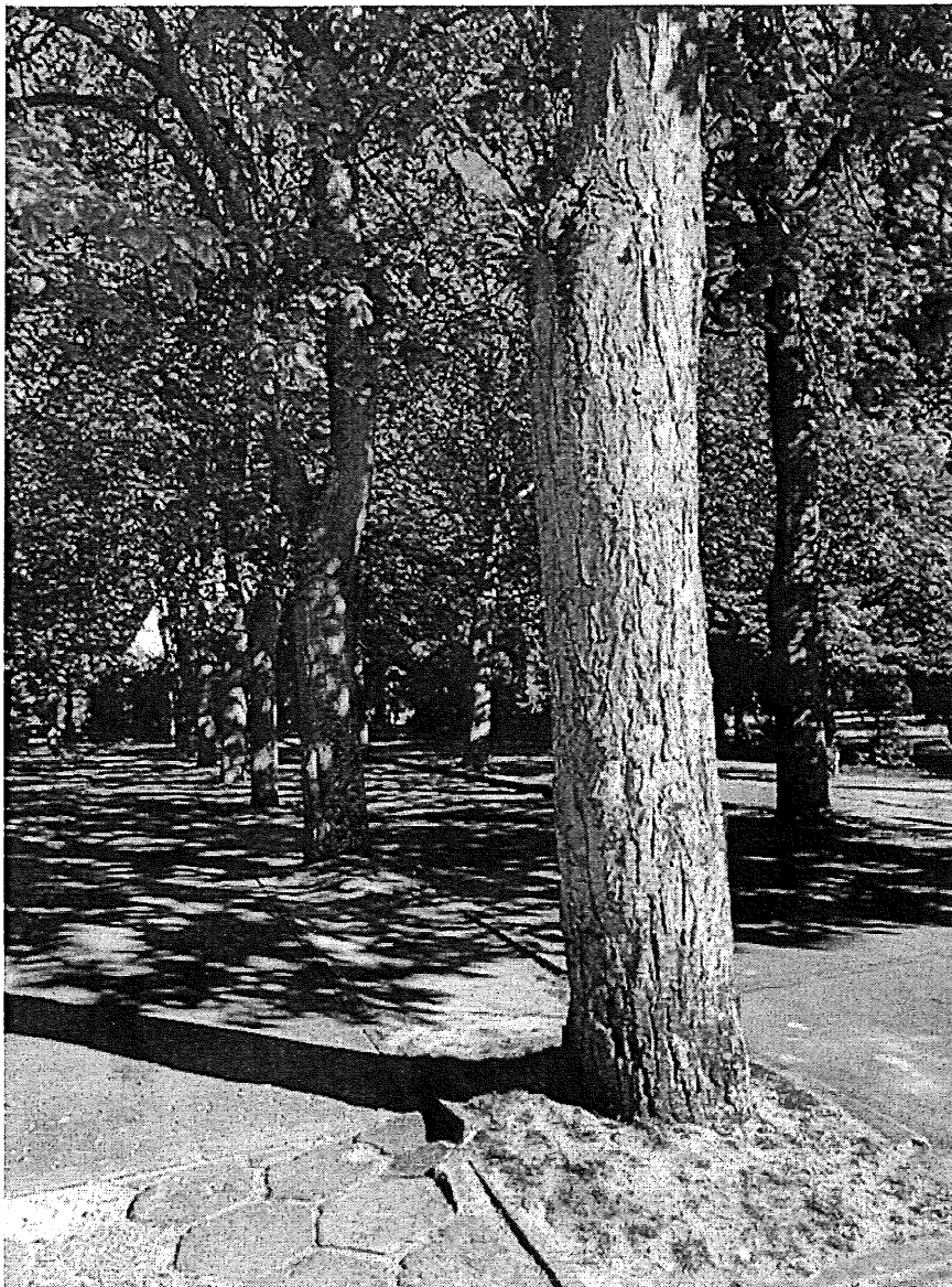
Fot. 2. Drzewa rosną w małej przestrzeni niezabudowanej trwale przy nasadzie pnia.

Lipy posadzone zostały w formie alejowej, po dwóch stronach ciągu komunikacyjnego prowadzącego do kaplicy cmentarnej. Asfaltowy wjazd służy jako droga dojazdowa dla pojazdów mechanicznych, a lipy odgradzają drogę od ciągów pieszych poprowadzonych po dwóch stronach alei lipowej.