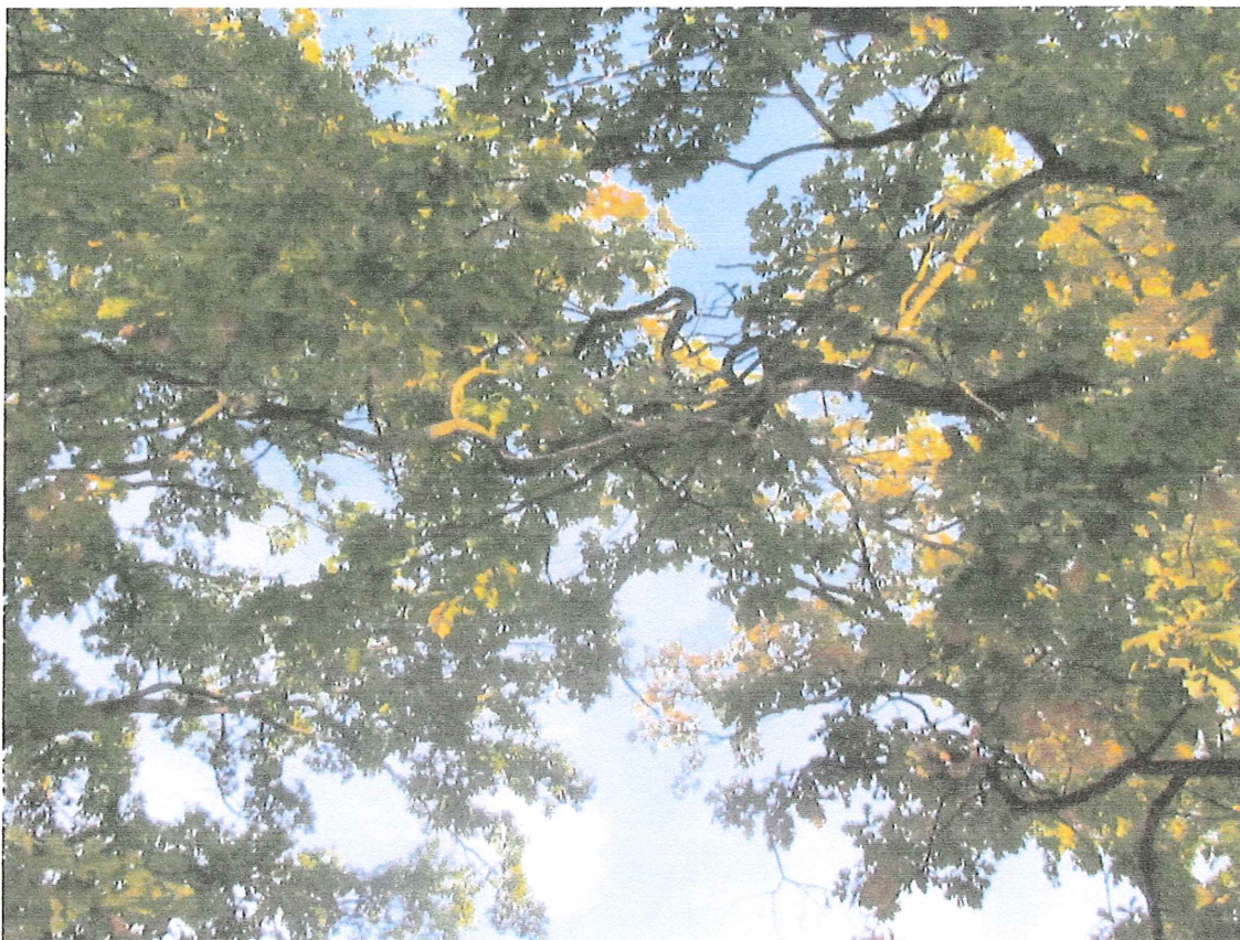
Fot. 1f. Posusz konarowy i gałęziowy