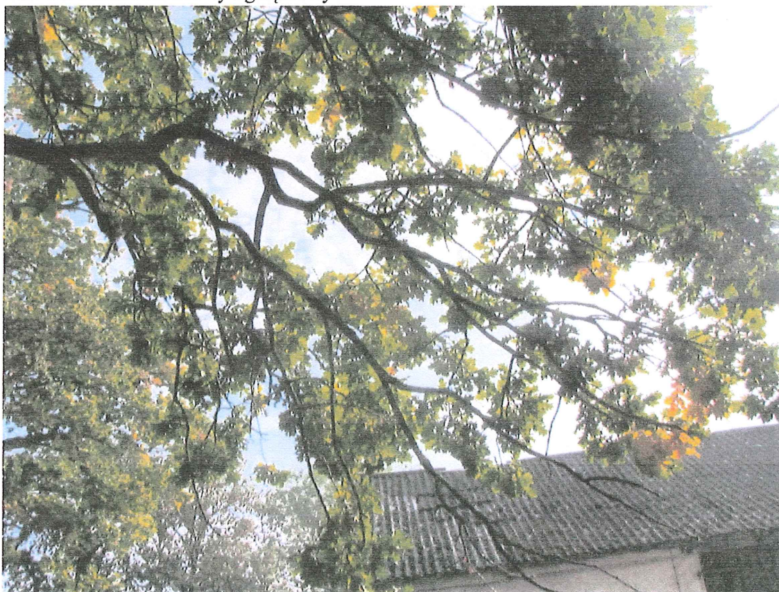
Fot. 1e. Posusz konarowy i gałęziowy