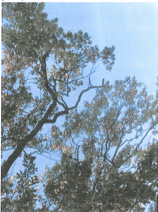
Fot. 1a. Posusz konarowy i gałęziowy

zmniejszenie przyrostów, a przy corocznym występowaniu nawet ich zamieranie. W przypadku drzew starszych porażenie jest mniej szkodliwe i nie wpływa znacząco na ich przeżywalność.