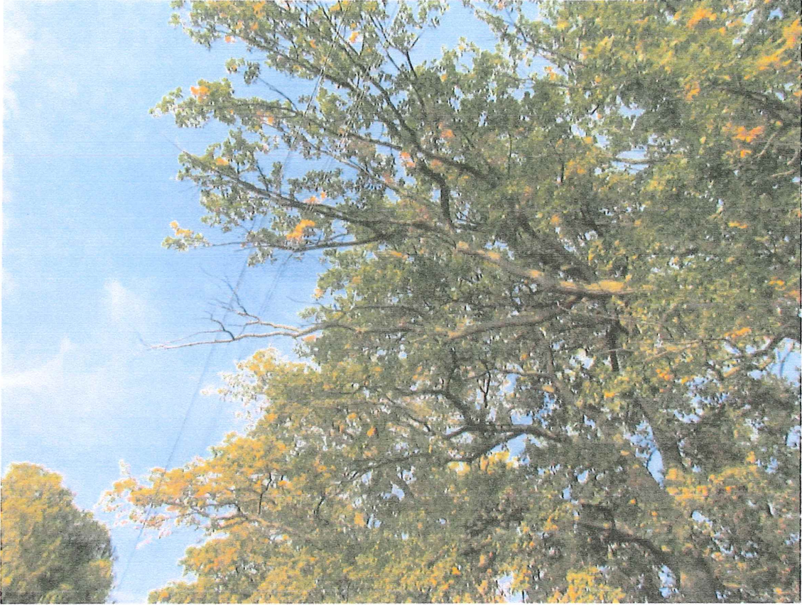
Fot. 2a. Gałęzie wrastające w linię energetyczną