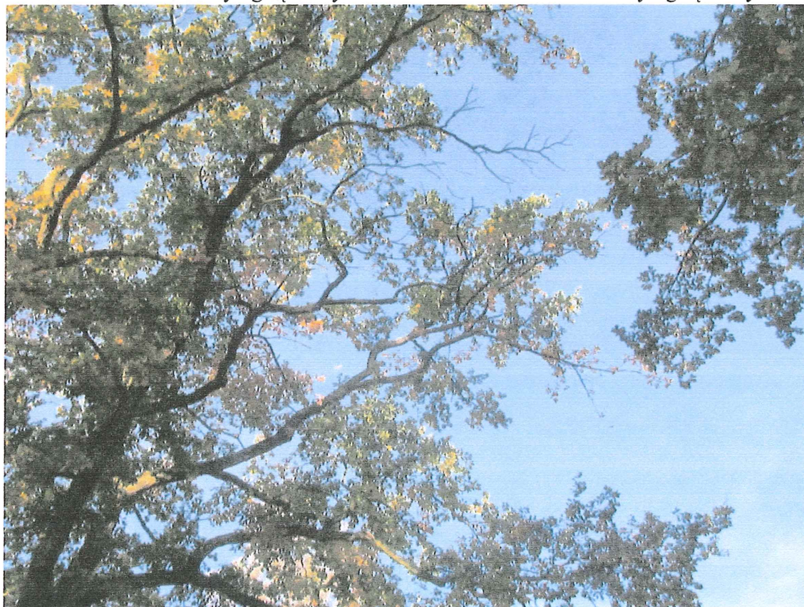
Fot. 1c. Posusz konarowy i gałęziowy