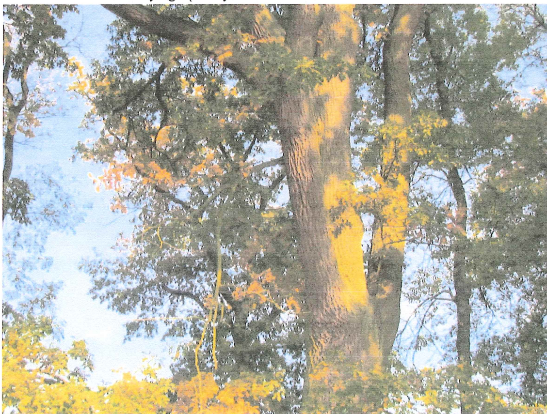
Fot. 1g. Posusz konarowy i gałęziowy