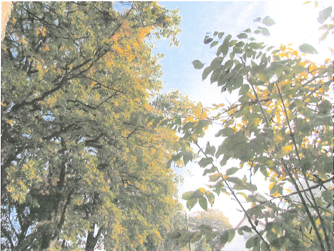
Fot. 2b. Gałęzie wrastające w linię energetyczną