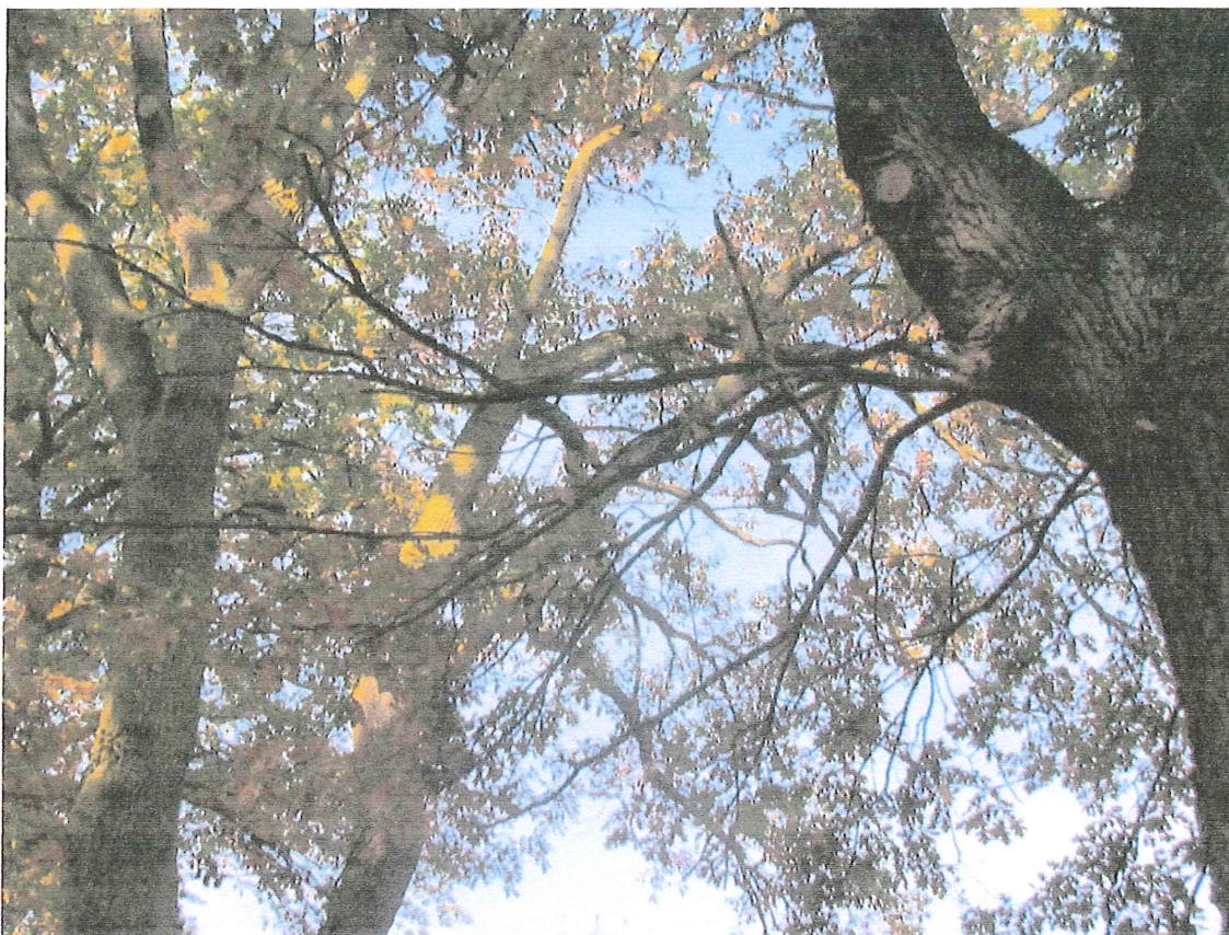
Fot. 1d. Posusz konarowy i gałęziowy