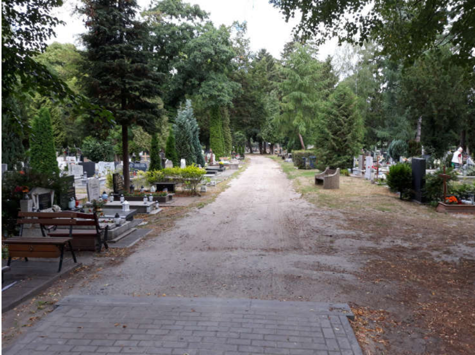
pkt.1 (patrz: mapa)