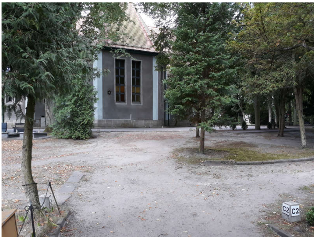
pkt.4 (patrz: mapa)