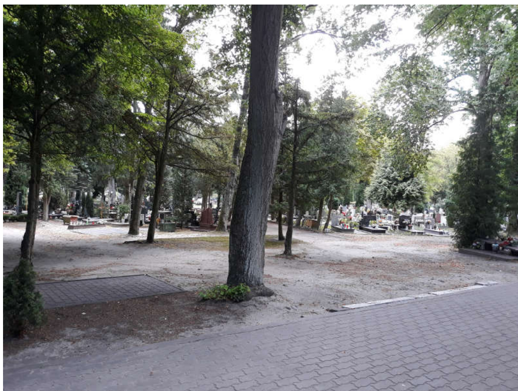
pkt.4 (patrz: mapa)