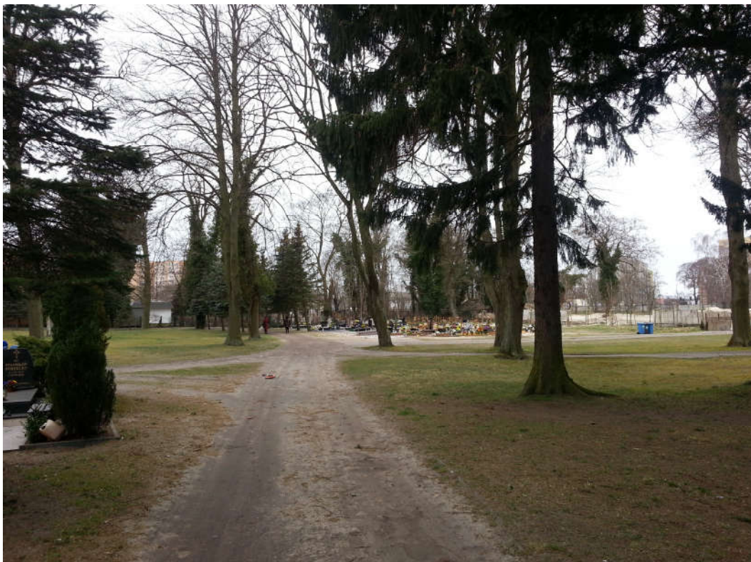
pkt.3 (patrz: mapa)