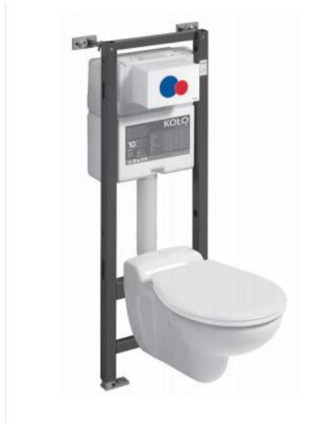
5. Przykładowy zestaw podtynkowy – podwieszany.