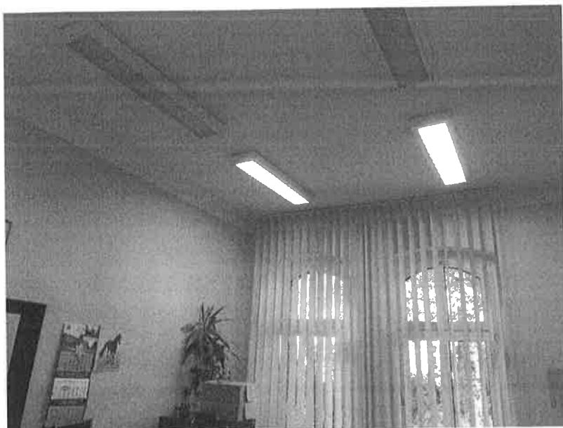
Fot.1. Widok na sufit i ściany pomieszczenia biurowego.