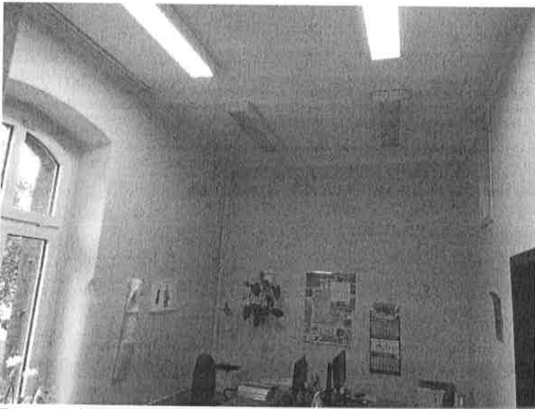
Fot.1. Widok na sufit i ściany pomieszczenia biurowego