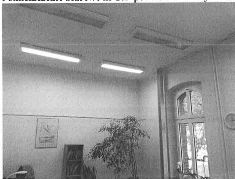
Fot.1. Widok na sufit i ściany pomieszczenia biurowego.