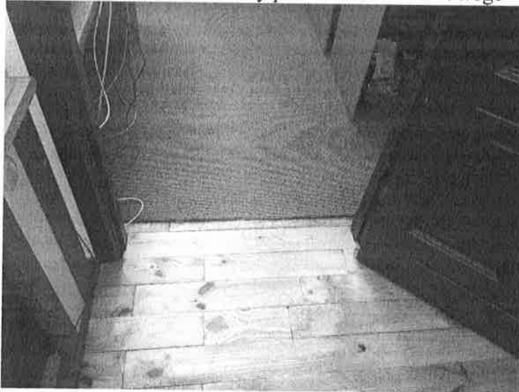
Fot.2. Widok na podłogę pomieszczenia biurowego