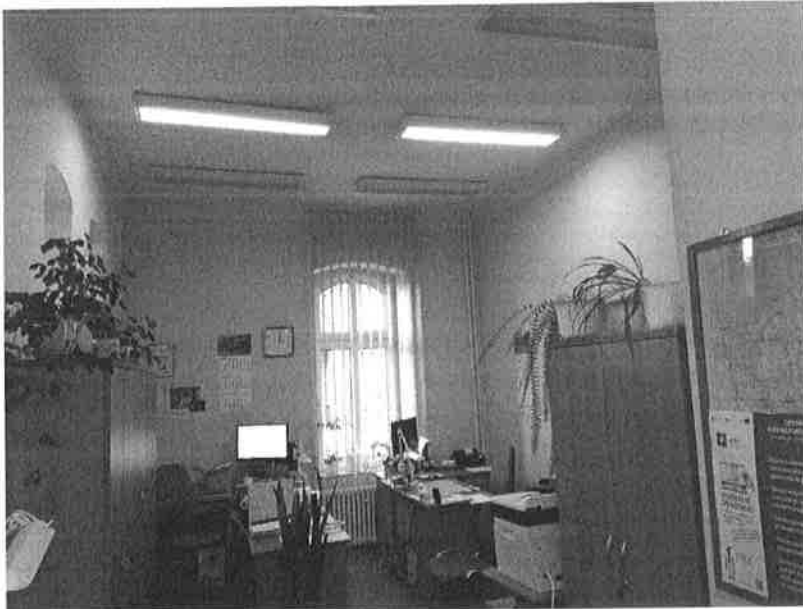
Fot.1. Widok na sufit i ściany pomieszczenia biurowego.