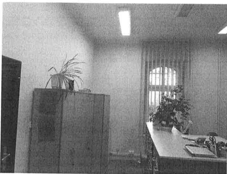
Fot.2. Widok na podłogę pomieszczenia biurowego