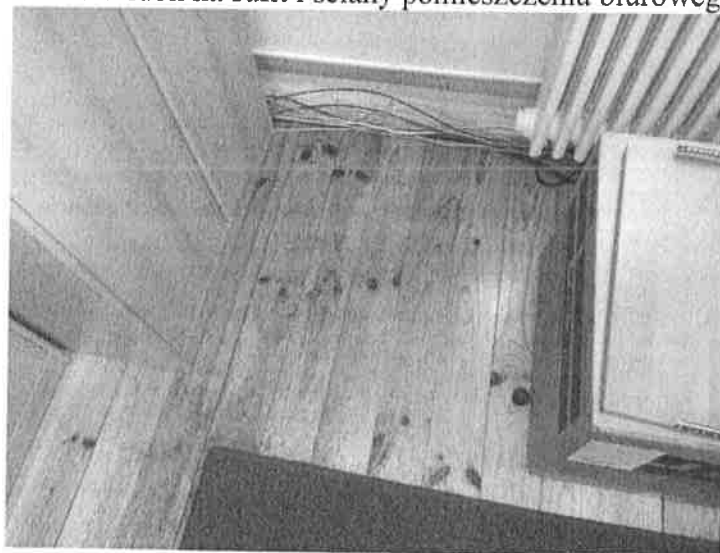
Fot.2. Widok na podłogę pomieszczenia biurowego