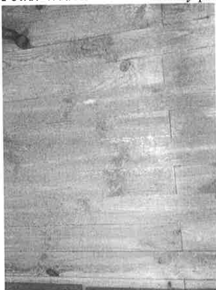
Fot.2. Widok na podłogę pomieszczenia biurowego