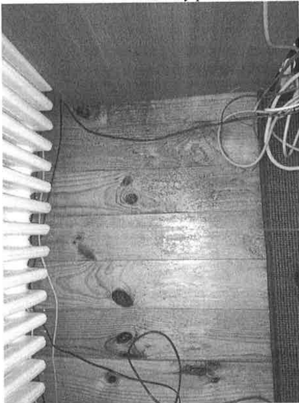
Fot.2. Widok na podłogę pomieszczenia biurowego