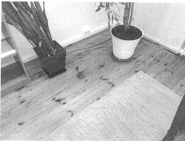
Fot.2. Widok na podłogę pomieszczenia biurowego