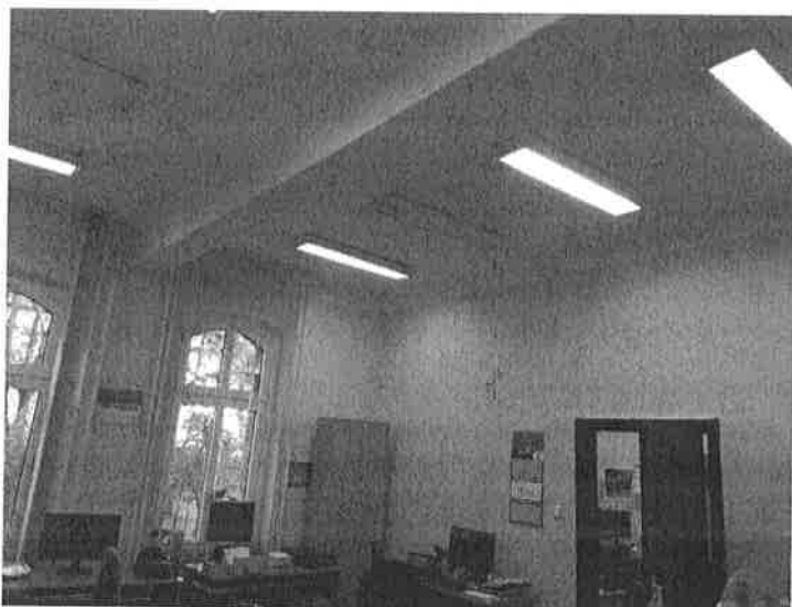
Fot.1. Widok na sufit i ściany pomieszczenia biurowego.