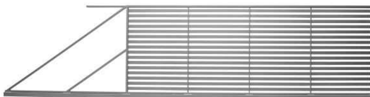
Rysunek 2 Wzór bramy

- brama wjazdowa przesuwna 300x90 cm (w zestawie znajduje się komplet zawiasowo-zamkowy). Konstrukcja zaprojektowana z profili prostokątnych 40x30 mm - rama i 50x10 mm - tralki ze stali ocynkowanej malowanej proszkowo w kolorze RAL 7016. W skrzydle zastosowano komplet zawiasowo-zamkowy.