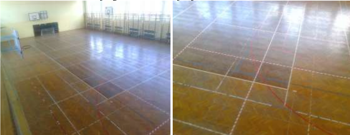
Fot. 2, 3.. Widok remontowanej nawierzchni sali gimnastycznej.

Rozebranie klepki parkietowej wraz z listwami przypodłogowymi oraz podłożem drewnianym, Naprawa ewentualnych pęknięć, ubytków podłoża betonowego posadzki Rozłożenie folii budowlanej o grubości nie mniejszej niż 0,2 mm.