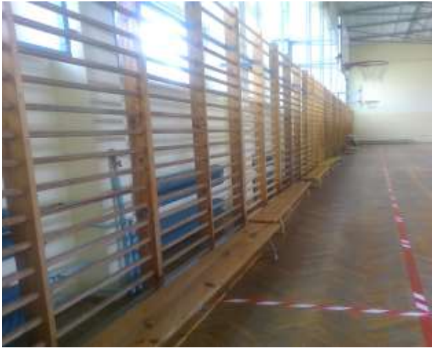
Fot. 1. Drabinki gimnastyczne do demontażu.

Zdemontowanie drabinek gimnastycznych (36 szt.) i ponowne ich zamontowanie po robotach posadzkowych.