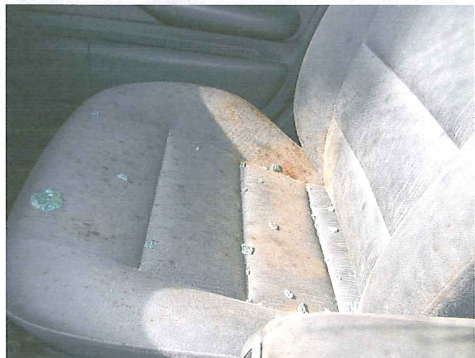
10 Widok wnętrza pojazdu-zbutwiała tapicetrka fotela pasażera.

RZECZOZNAWCA SAMOCHODOWY Nr ident. Min. Infrastruktury RS 000287 mgr inż. Zenon Nogal