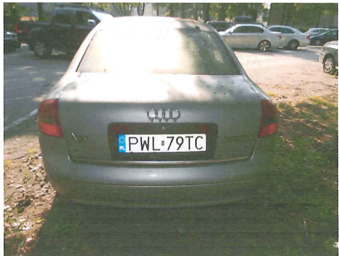
6 Widok tyłu pojazdu.