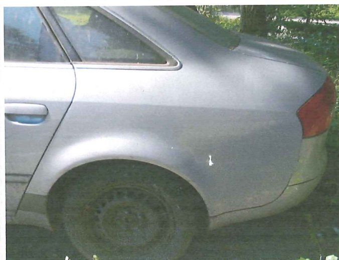
22 Poszycie t.l. - głębokie rysy powłoki lakierowej.