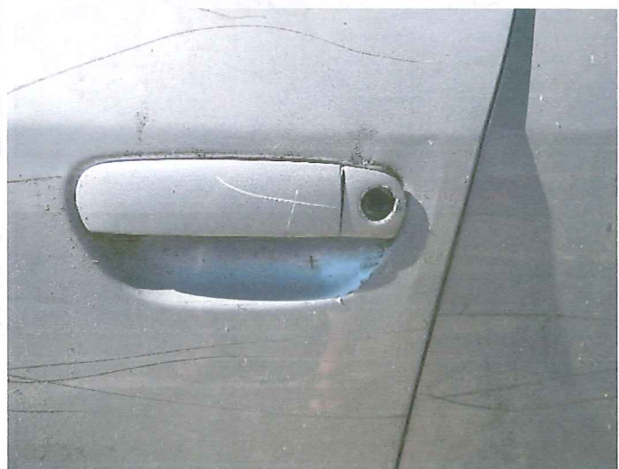
8 Uszkodzony zamek drzwi p.l.