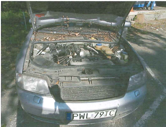
5 Widok komory silnika pojazdu.