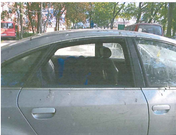
7 Wybita szyba w drzwiach t.p.