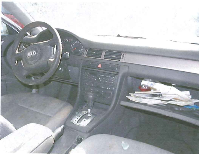
15 Widok wnętrza pojazdu.