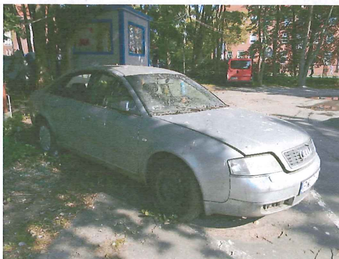
2 Widok ogólny pojazdu.