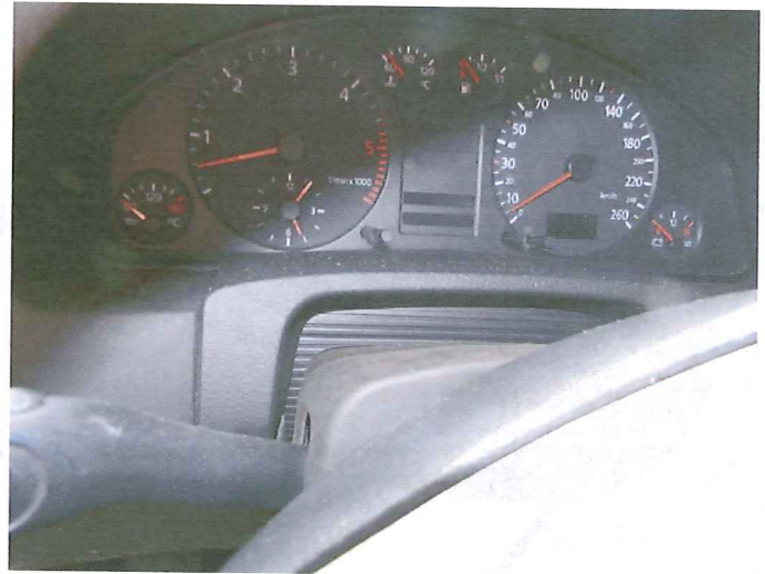
12 Widok wnętrza pojazdu.