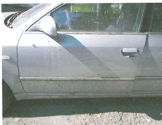
20 Drzwi p.l.- głębokie rysy powłoki lakierowej.