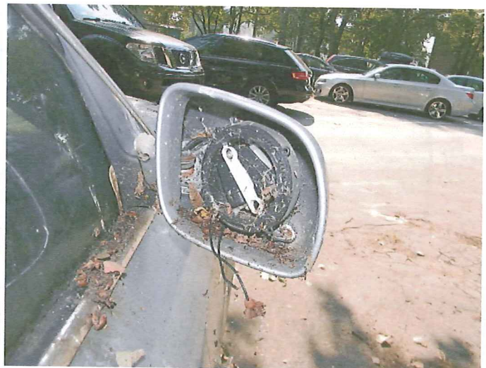
16 Brak wkładu lusterka zewnętrznego prawego.

RZECZOZNAWCA SAMOCHODOWY Nr ident. Min. Infrastruktury RS 000257 mgr inż. Zenon Nogal