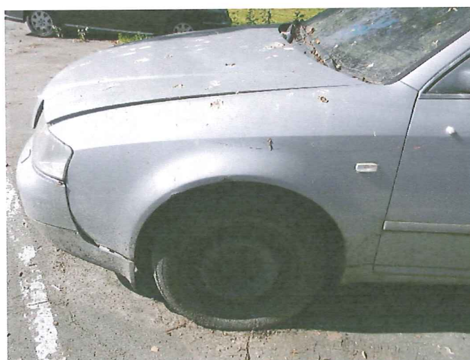
19 Błotnik p.l. - głębokie rysy powłoki lakierowej.