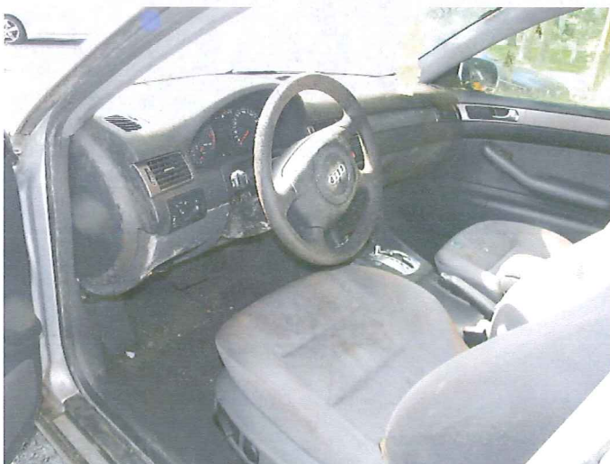
9 Widok wnętrza pojazdu.