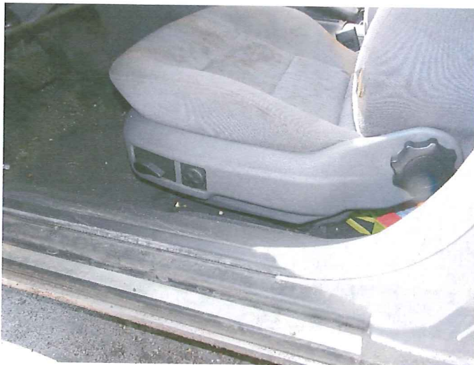
13 Widok wnętrza pojazdu.