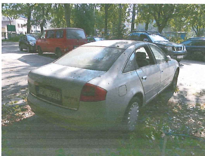
4 Widok ogólny pojazdu.

RZECZOZNAWCA SAMOCHODOWY Nr ident. Min. Infrastruktury RS 000257 mgr inż. Zenon Nogal