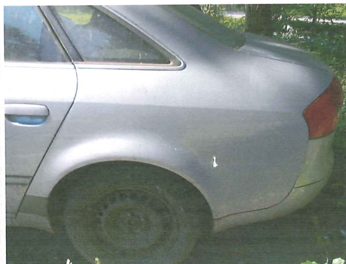
22 Poszycie t.l. - głębokie rysy powłoki lakierowej.