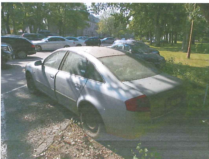
3 Widok ogólny pojazdu.