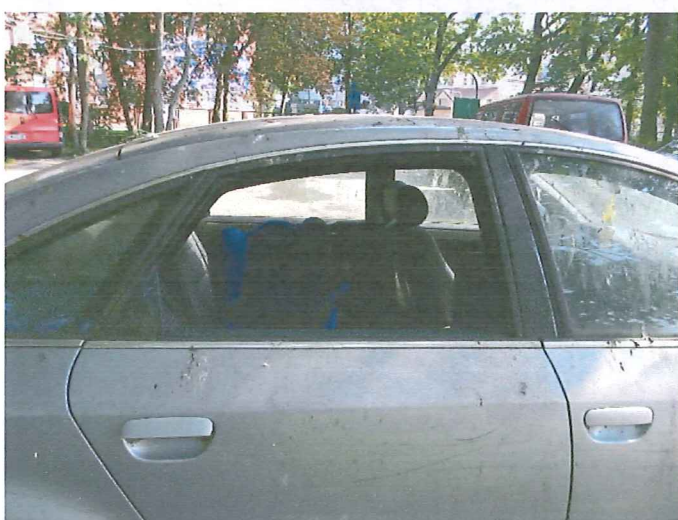
7 Wybita szyba w drzwiach t.p.