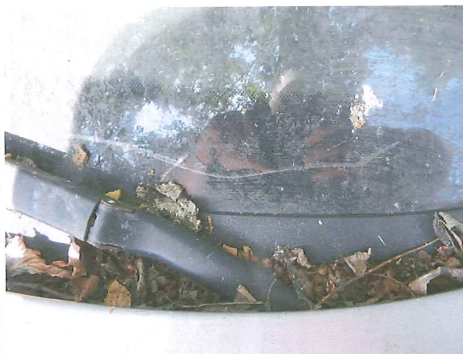
18 Pęknięta szyba czołowa.