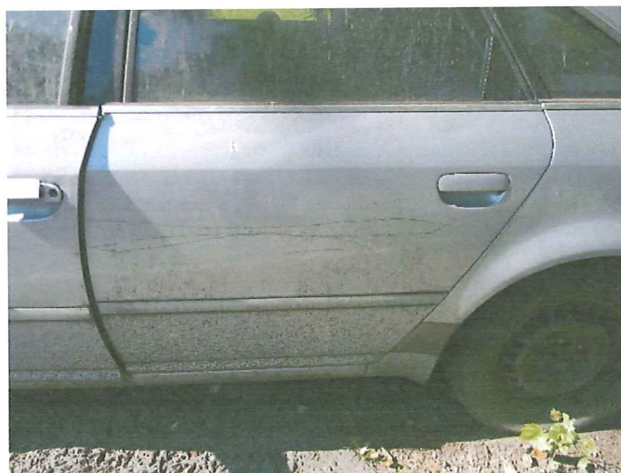
21 Drzwi t.l. - głębokie rysy powłoki lakierowej.