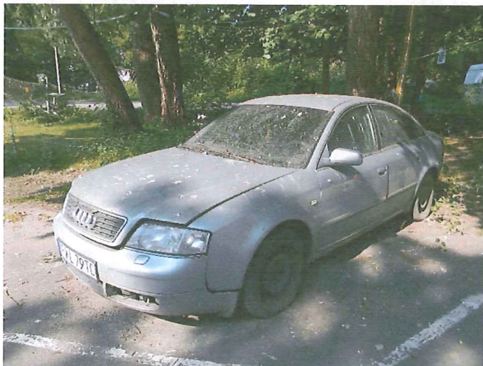
1 Widok ogólny pojazdu.