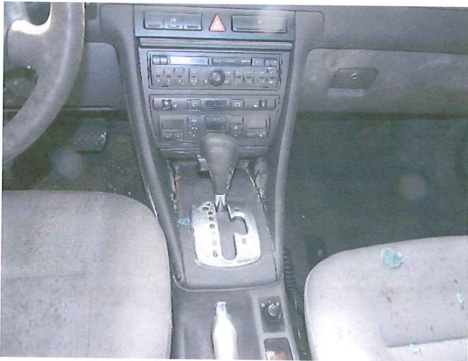
11 Widok wnętrza pojazdu.