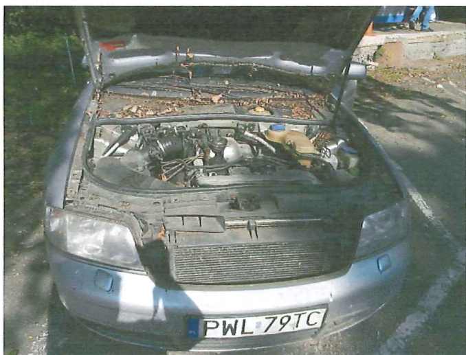
5 Widok komory silnika pojazdu.