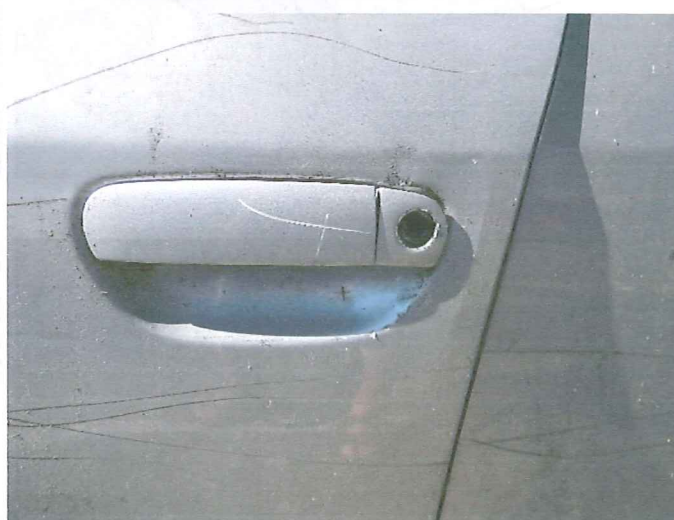
8 Uszkodzony zamek drzwi p.l.