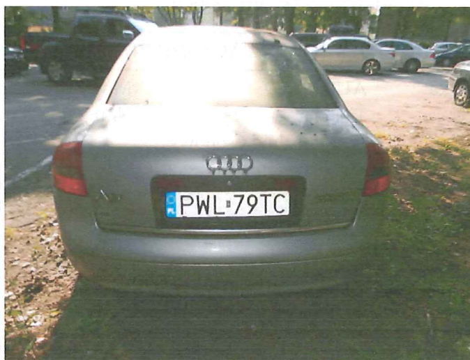
6 Widok tyłu pojazdu.