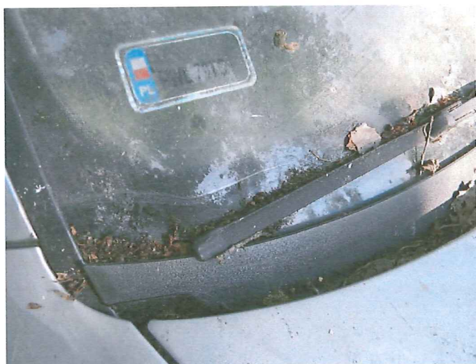
17 Pęknięta szyba czołowa.