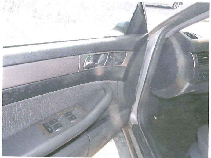
14 Widok wnętrza pojazdu.