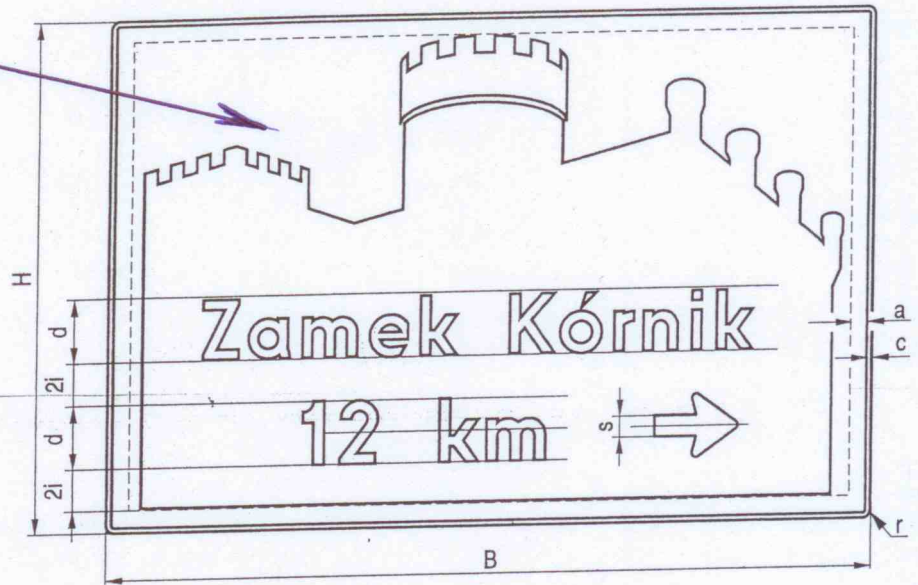
Rys. 9.5.56. Konstrukcja znaku E-22b