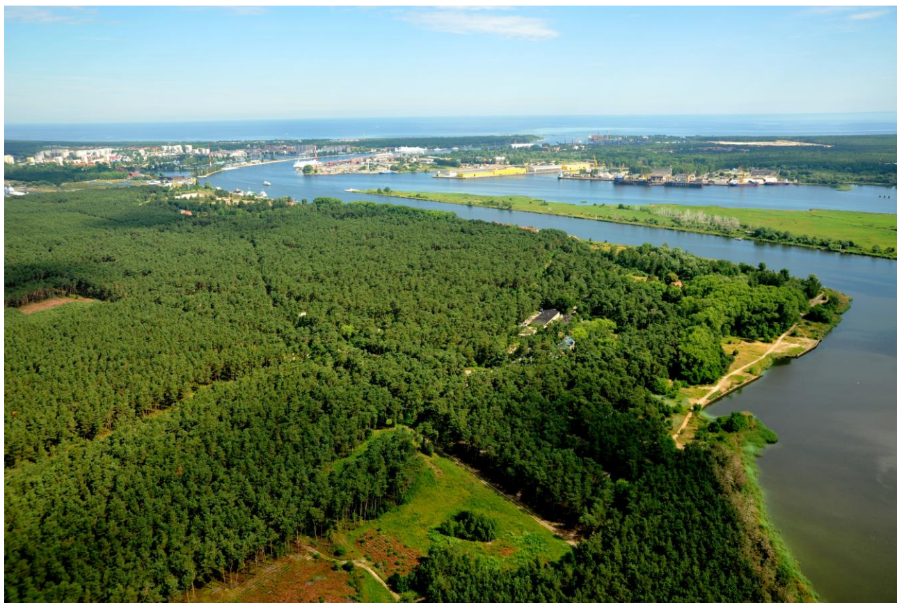
Zdjęcie 1 Tereny Mulnika

Tereny pod utworzenie Centrum są mocno zdegradowane (teren powojсковy, eksploatowany przez wojska radzieckie). Obszar położony w zachodniej części Centrum został już zagospodarowany przez różne podmioty gospodarcze np. Baltchem S.A, Poltramp Yard, OT Logistic. Do tej części strefy doprowadzone są media: woda, kanalizacja i energia elektryczna. Z powodu braku dróg odpowiedniej jakości (istniejące drogi to drogi gruntowe) dojazd do tych firm jest utrudniony. Natomiast cała wschodnia część terenów przeznaczonych pod rozbudowę Centrum (dalej w treści ta część oznaczona jako CUM1 zlokalizowana na dz. 254/4 Świnoujście obr. 10) pozbawiona jest dróg oraz podstawowych mediów. W związku z tym zagospodarowanie zdegradowanych powojсковych,