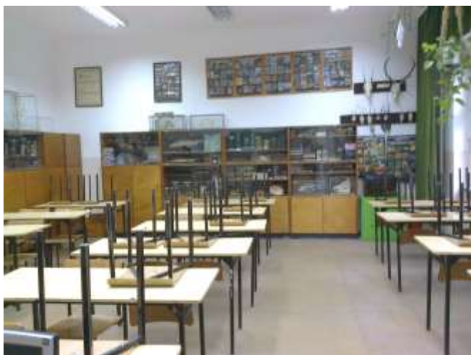
Fot.3. Podłoga w sali nr 12 do remontu.

- rozbiórka istniejącej nawierzchni z wykładziny rulonowej pcv, rozbiórka listew przypodłogowych pcv, naprawa istniejącego podłoża betonowego – wyrównanie, szlifowanie, położenie wykładziny podłogowej typu marmoleum fresco, rulonowej o szerokości 2 m, łączenia zgrzewane w kolorze dopasowanym do koloru wykładziny. Wykładzina homogeniczna, grubość powyżej 2,50 mm, klasa ścieralności T, odporność na wgniecenia mniejsza niż 0,10 mm z wykończeniem listwami przypodłogowymi systemowymi z pcv – takimi samymi jak zdemontowane.