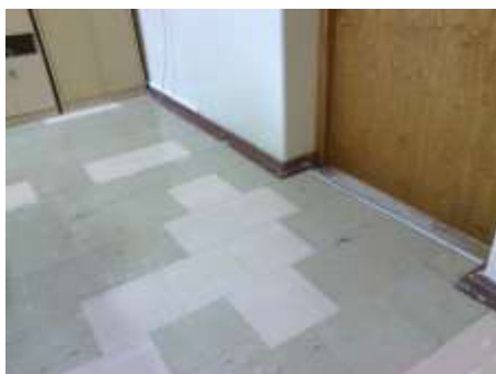
Fot. 1. Posadzka do wymiany.

- rozbiórka istniejącej nawierzchni z płytek pcv, rozbiórka listew przypodłogowych, rozbiórka istniejącego podłoża pod płytki, wyrównanie, wypoziomowanie, i położenie płyt OSB gr. około 2cm – dwie warstwy mijankowo, płyty łączone na zakład, szlifowanie i szpachlowane na łączeniach, położenie wykładziny podłogowej typu marmoleum fresco, rulonowej o szerokości 2 m, łączenia zgrzewane w kolorze dopasowanym do koloru wykładziny. Wykładzina homogeniczna, grubość powyżej 2,50 mm, klasa ścieralności T, odporność na wgniecenia mniejsza niż 0,10 mm z wykończeniem listwami przypodłogowymi systemowymi z pcv wysokości około 7 cm,