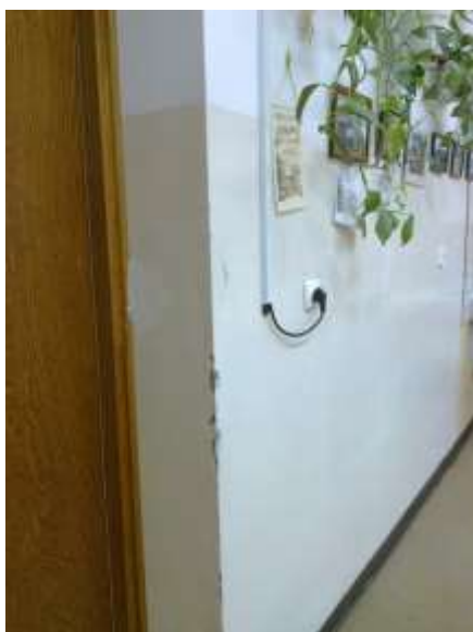
Fot. 4. Narożniki do remontu.