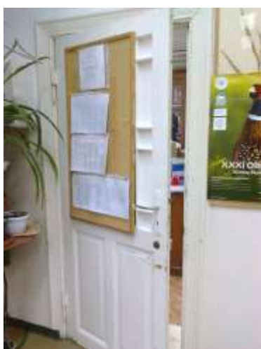
Fot.7. Drzwi do remontu.