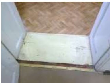
Fot.8. Ościeżnica skrzynkowa do remontu.