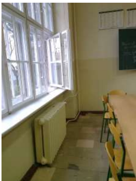
Fot. 2. Grzejnik i okna do malowania.

- wymiana 2 szt. wyłączników świecznikowych podtynkowych: prąd AX napięcie 250 V, stopień ochrony IP 20, wyłącznik z tworzywa termoplastycznego, wykończenie gładkie, przekrój przewodów 3x2,5 mm 2 , kolor biały,