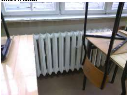
Fot. 6. Grzejniki i stolarka okienna do malowania.