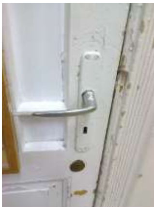
Fot. 9. Zamek z szyldem oraz klamką do wymiany.

- remont drzwi wewnętrznych (wraz z ościeżnicą skrzynkową i opaską drewnianą) do zaplecza sali – usunięcie warstwy farby olejnej (opalenie), uzupełnienie ubytków drewna, szpachlowanie specjalistyczną szpachlą dobraną do koloru drewna drzwi, szlifowanie, lakierowanie lakierem do drewna matowym z wcześniejszym gruntowaniem. Wymiana szyldu drzwiowego wraz z klamką – dopasować do starych wyremontowanych drzwi w uzgodnieniu z Zamawiającym.