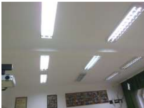
Fot. 5. Sufit do malowania.