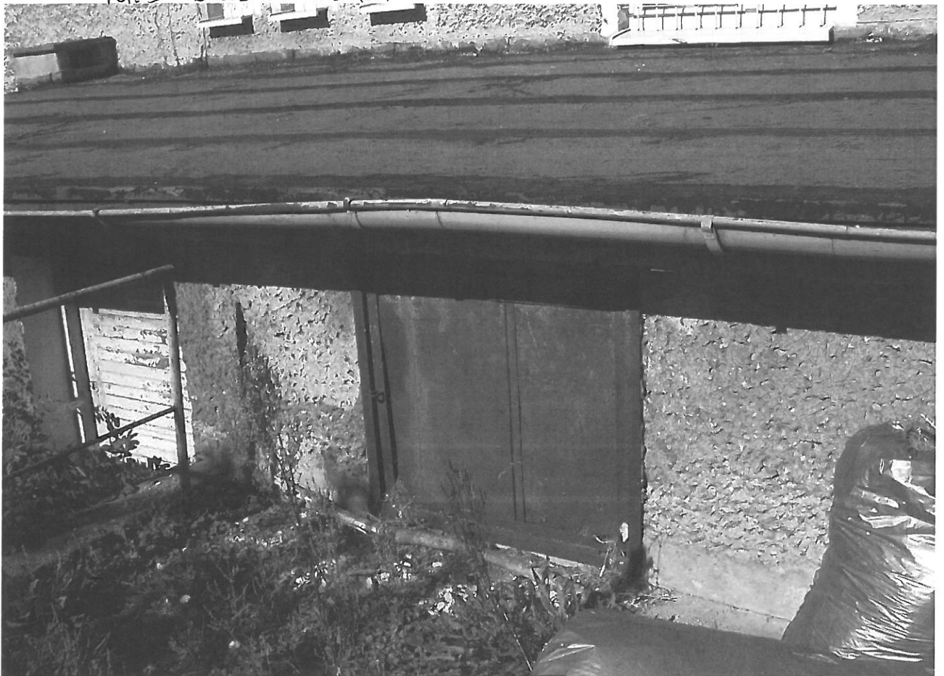
FOT. 6 KOTŁOWNIA - WEJŚCIE DO POZIOMU PRZYZIEMIA