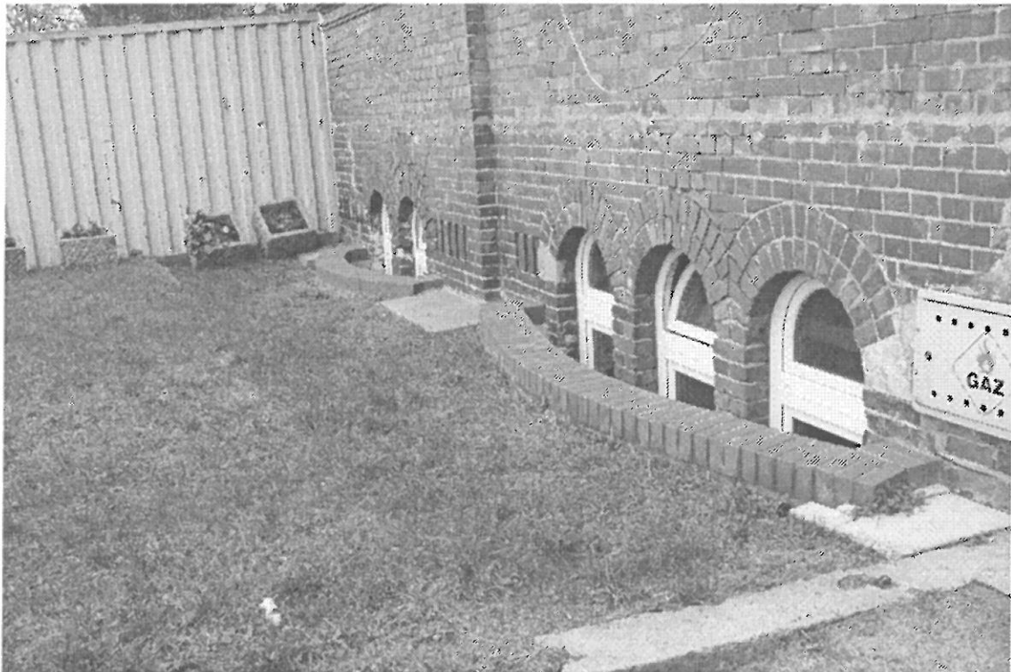
W STROMEŃ CIODNIKA.