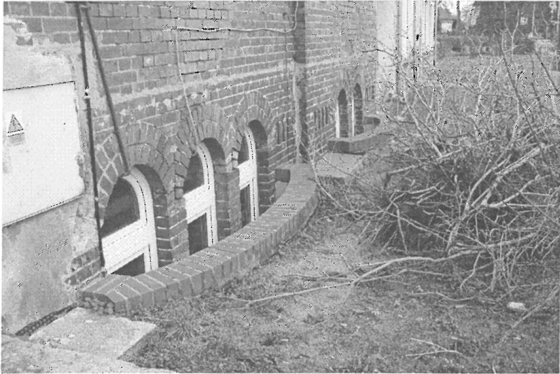
FOT. 2 J.W. - MNIEJACZA TERENU OD POZOMU GRUNTU PRZY CEGACH KUNCIERZONYCH ZE SPADKIEM