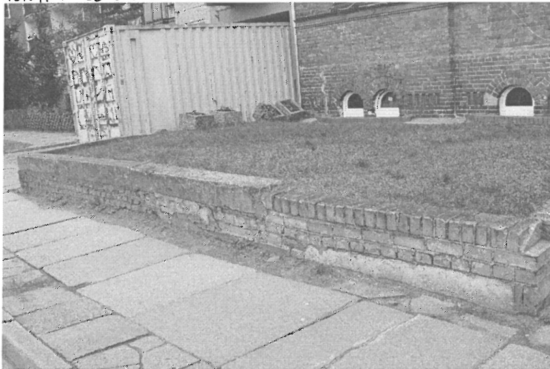
MURCOŁ Z CEGŁY KUNCIEROWEJ PRZY BUDYNKU ZE SPADKIEM DO POZIOMY CHODNIKA.