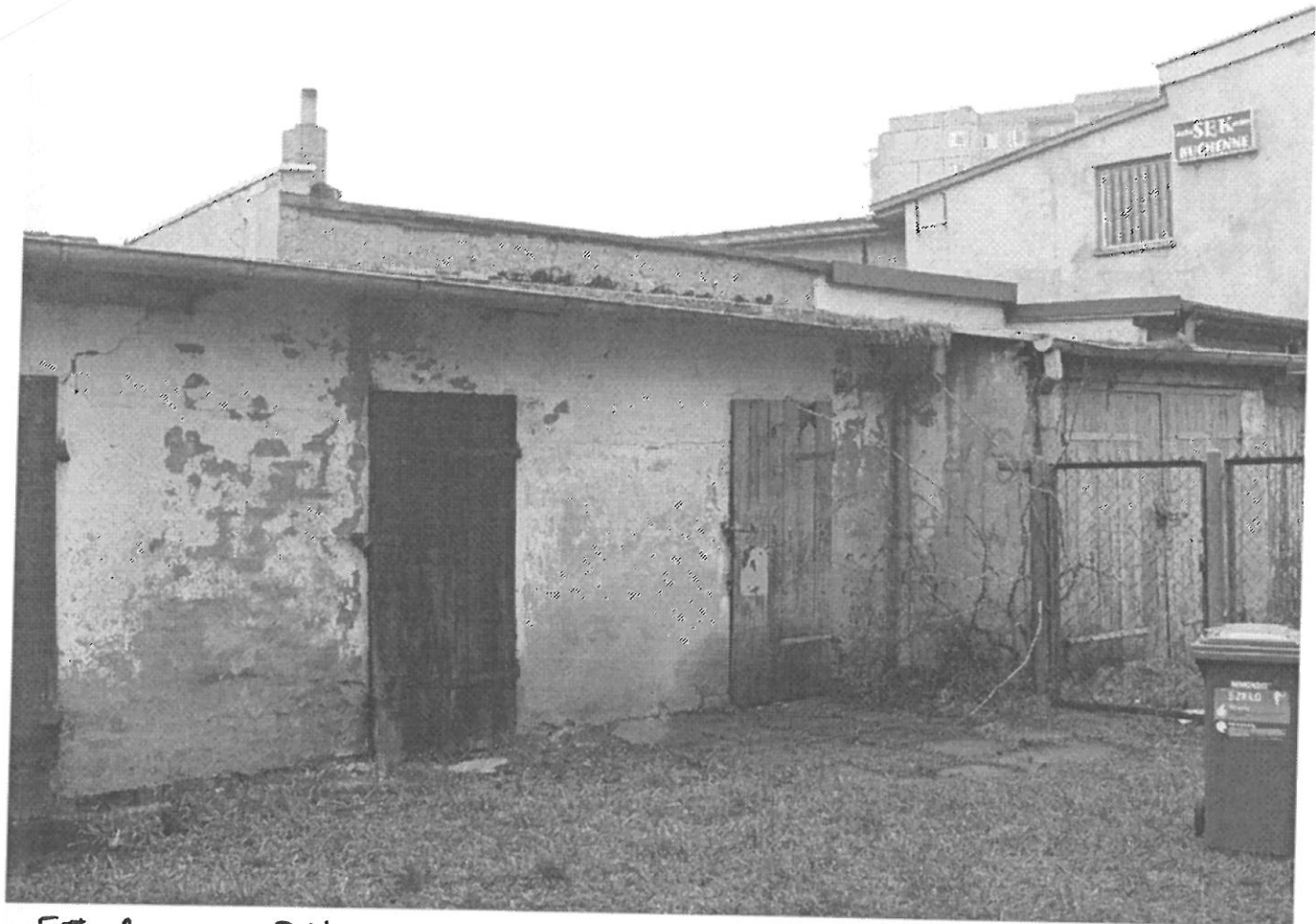
Fot. 2 J.W