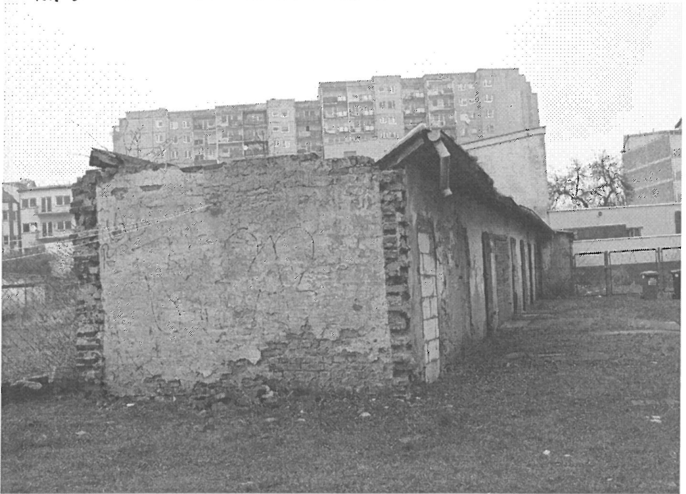
FOT. 4 J.W.