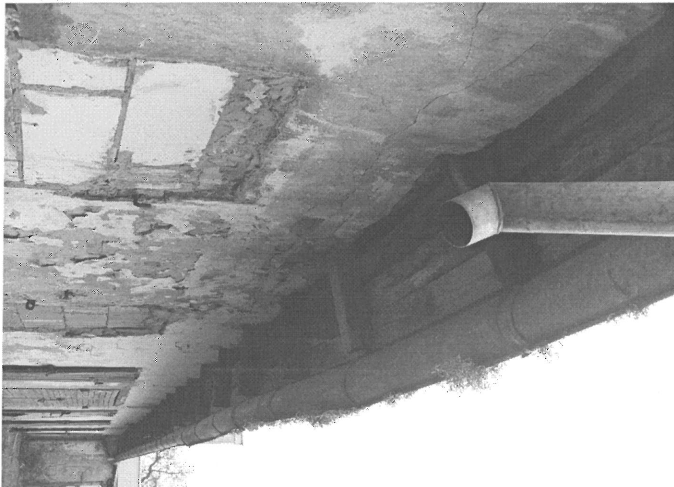
FOT. 6 J.W.