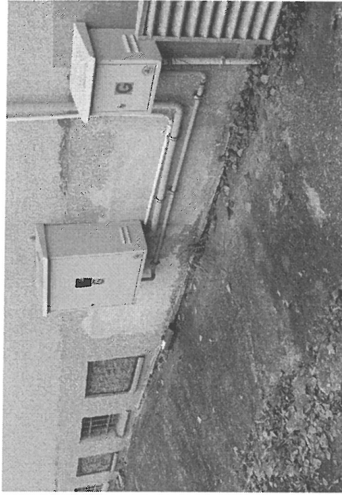
OPASKA BETONOWA DO ROZWIĄZANIA