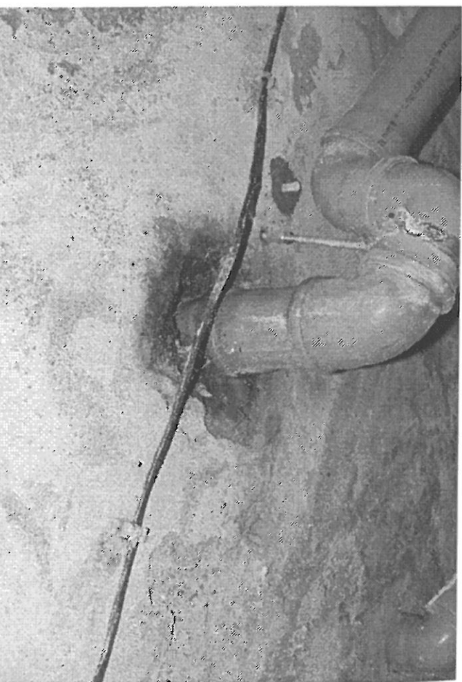
RURA KANALIZACYJNA - PRZEJŚCIE DO WYMIANA