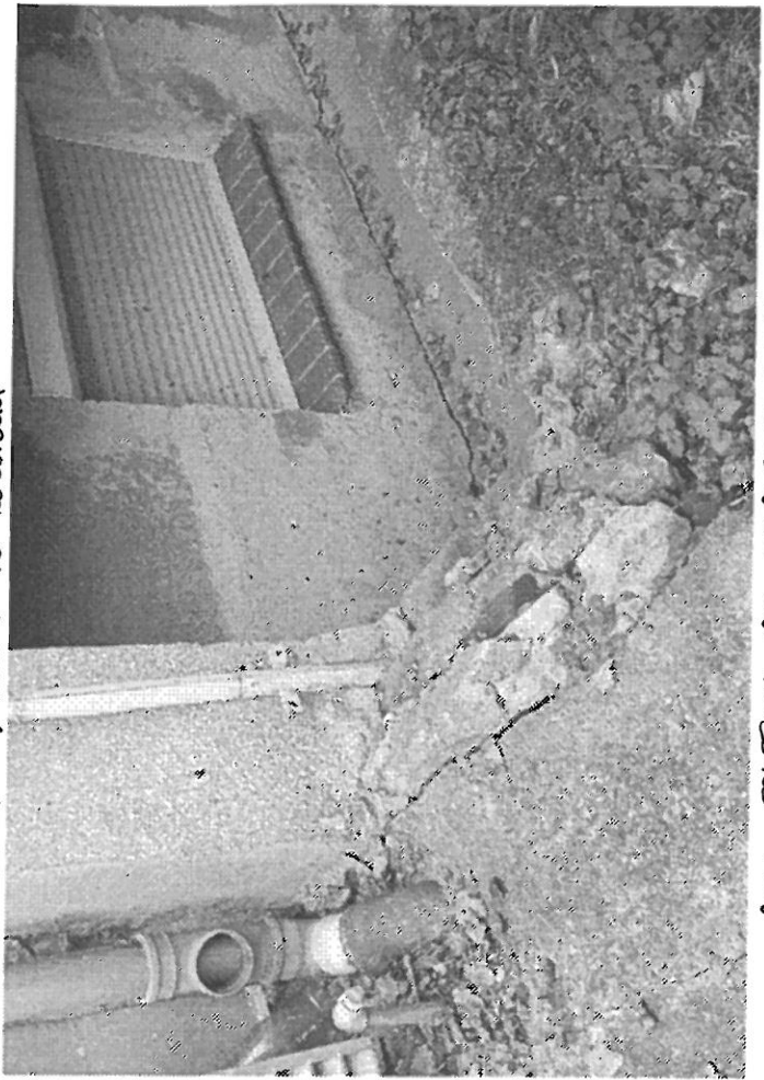
PARA SPUSZCZAJĄCA DO WODOKANALIZACJI (LUB ODKWAMNIENIA NAJ TEREN ZIELONY)