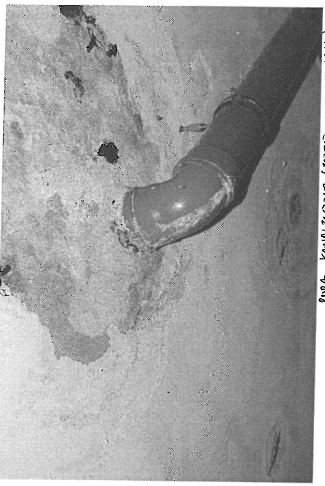
RURA KANALIZACYJNA (PRZEJŚCIE DO ŁAMIAKÓW)