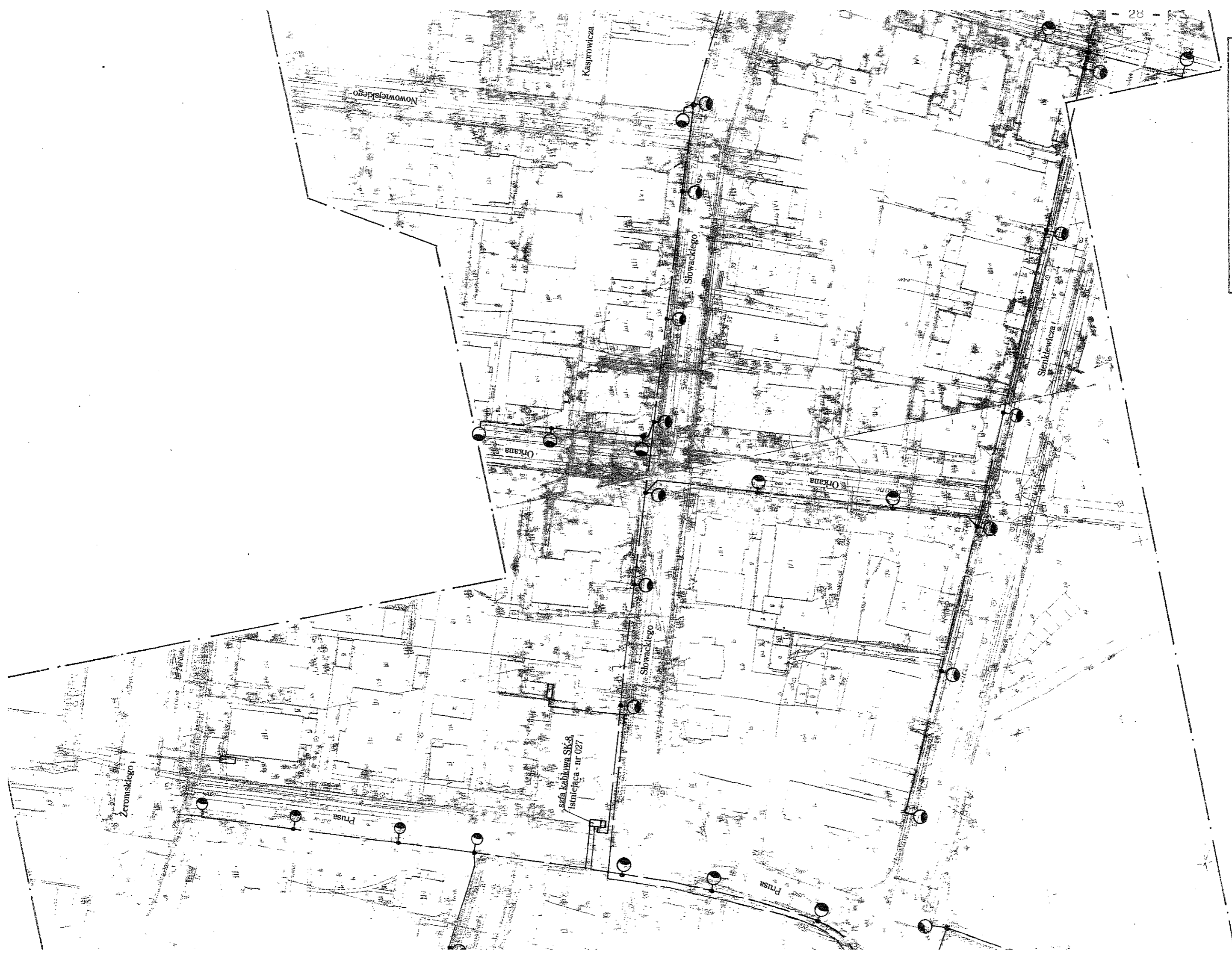
Zat. 3 Inwentaryzacja oświetlenia ulic Rysunek poglądowy.