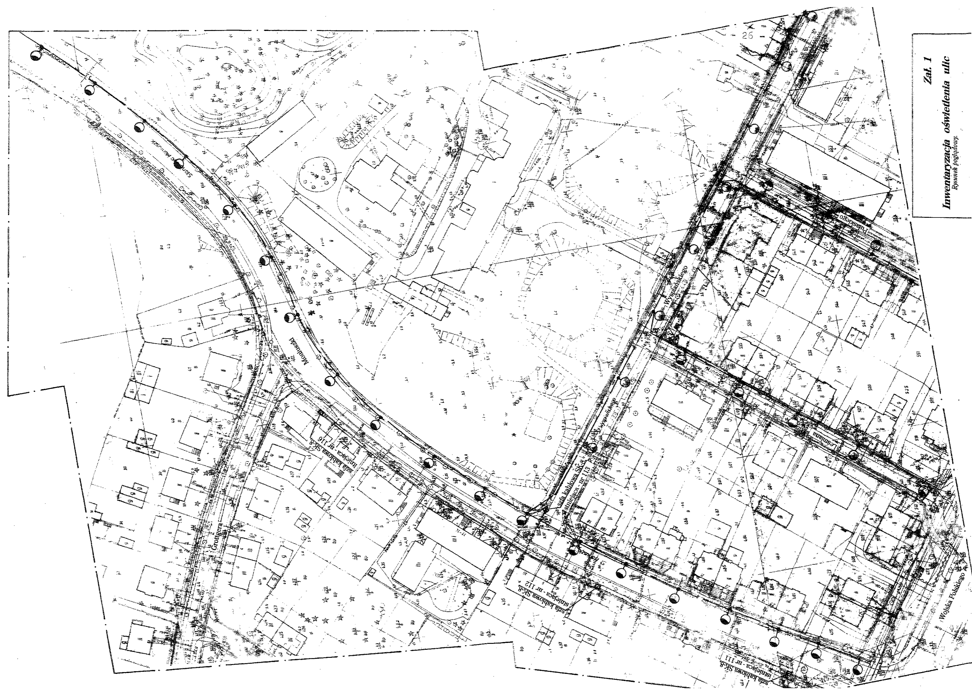
Zat. 1 Inwentaryzacja oświetlenia ulic Rysunek poglądowy.