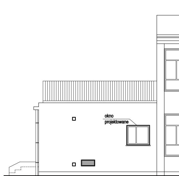
ELEWACJA POŁUDNIOWA - fragment 1:100