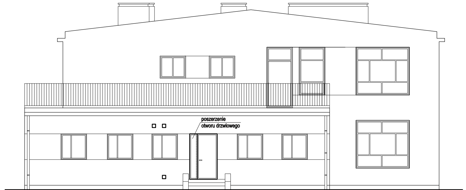
ELEWACJA ZACHODNIA 1:100