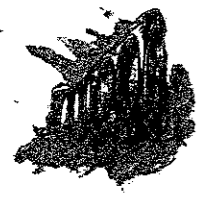
TRZESACZ Ruiny gotyckiego kościoła z XIV-XV w 2F