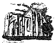
WOLIN Ruiny kościoła św. Mikołaja z XV w 4D

bpik BIURO PROJEKTÓW INFRASTRUKTURY KOMUNALNEJ 70-206 Szczecin, ul. Dworcowa 2a tel.812 26 20, tel/fax.812 26 21