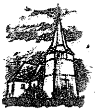
KONIEWO Kościół z drewnianą wieżą 4D