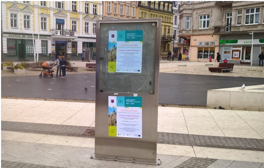
Plac Wolności – informacja o spacerach i debatach.

Informacja o spacerach i debatach została upowszechniona w formie rozplakotowania na terenie miasta – w rejonie planowanych obszarów rewitalizacji.