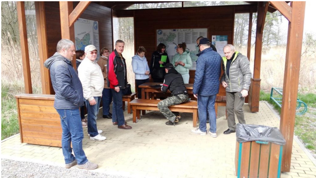
Spacer studyjny po podobszarze rewitalizacji Karsibór 3 kwietnia 2017 r.