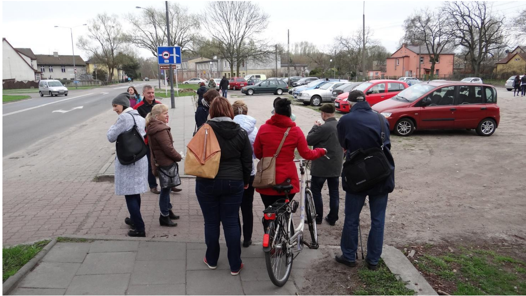
Spacer studyjny po podobszarze rewitalizacji Warszów 5 kwietnia 2017 r.

W dniach 28 marca-26 kwietnia 2017 roku interesariusze mogli również wypełnić ankiety dotyczące projektu uchwały Rady Miasta Świnoujście w sprawie wyznaczenia obszaru zdegradowanego i obszaru rewitalizacji na terenie Gminy Miasto Świnoujście. Ankiety były dostępne w: Urzędzie Miasta Świnoujście na Stanowisku ds. Obsługi Interesantów, Miejskim Domu Kultury – Filii nr 2-Warszów oraz Filii nr 3-Karsibór, Miejskiej Bibliotece Publicznej im. Stefana Flukowskiego. Łącznie wypełniono 13 ankiet, przy czym 7 dotyczyło wyrażenia pozytywnej opinii na temat proponowanych podobszarów rewitalizacji i propozycji przedsięwzięć rewitalizacyjnych.