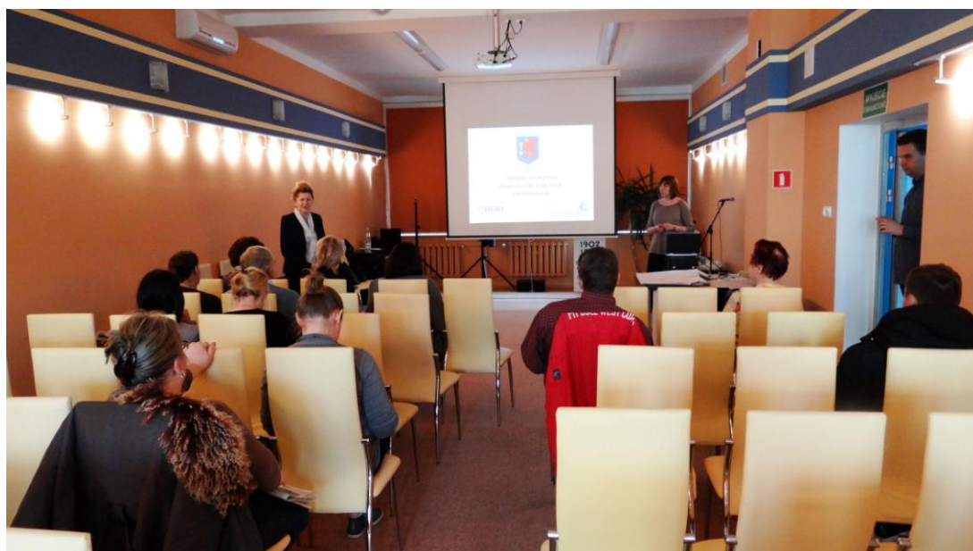
Debata w Miejskiej Bibliotece Publicznej im. Stefana Flukowskiego 06.04.2017 r.