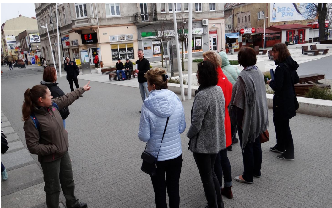
Spacer studyjny po podobszarze rewitalizacji Centrum 4 kwietnia 2017 r.