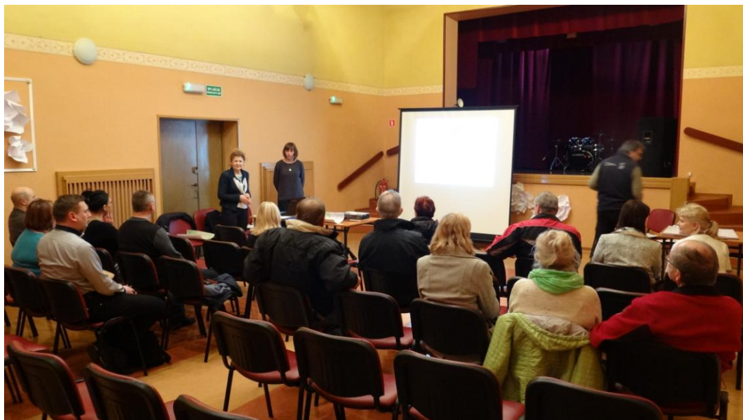
Debata w Miejskim Domu Kultury Filia nr 2 – Warszów 05.04.2017r.