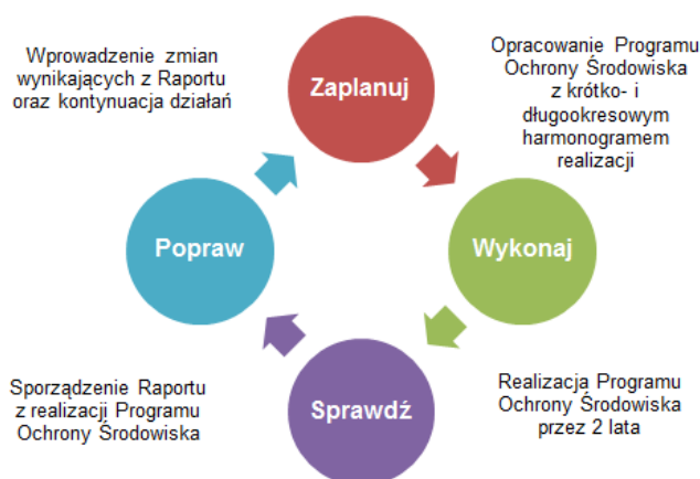
Ryc. 3. Cykl Deminga przeniesiony na poziom opracowywania POŚ